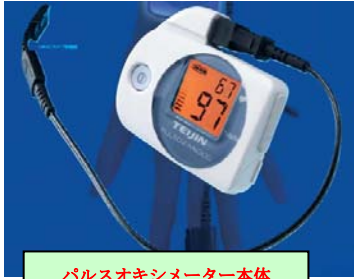
パルスオキシメーター本体

今回のSASの音では、SASのスクリーニングに用いる パルスオキシメーター という検査機器の有用性についてお話したいと思います。